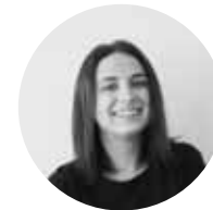
Timea správca sociálnych sietí redaktorka