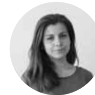
Katka šéfredaktorka printovej verzie grafička